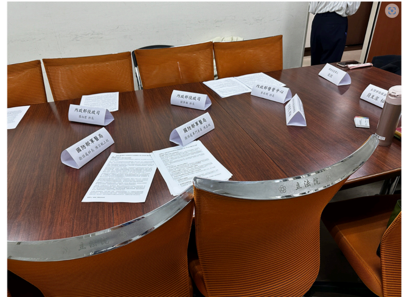
▲ 2025年12月23日協調會議桌面